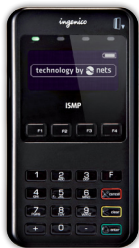
MOBILE INTEGRERET ISMP